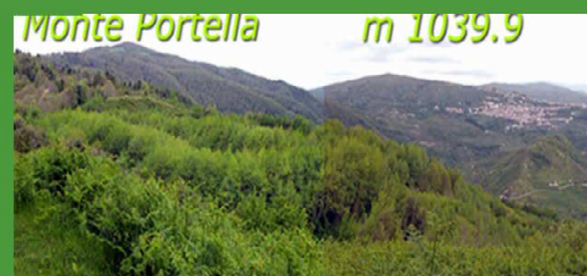
Monte Portella m 1039.9