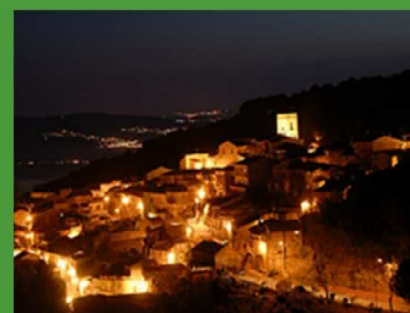
il borgo di Miglierina

La rete sentieristica facente parte del progetto Bosco Animato è parte di un progetto di valorizzazione rivolto al turismo escursionistico e al trekking che attraversa aree di alto interesse naturalistico e paesaggistico, quali le aree che lambiscono il fiume Amato e le zone vicine alla fonte d'acqua del monte Portella, aree rurali ed agricole. La rete sentieristica è intervallata da aree ricreative didattiche ed è in buona parte percorribile anche in bicicletta. Nella scelta dei tracciati si è data preferenza ai percorsi pedonali di uso storico usati per secoli per gli spostamenti di uomini, greggi.